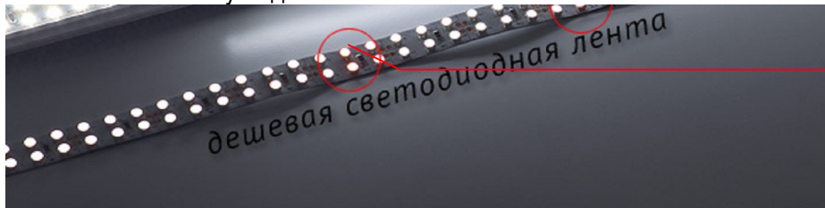
Цветовые пятна и неравномерность светового потока

3. Дешевая светодиодная лента обладает меньшей яркостью. Зачастую заявленные характеристики и световой поток не соответствуют действительности.